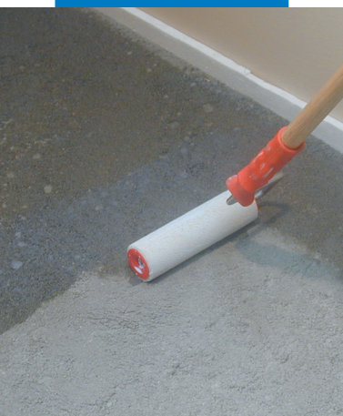
Applicazione di Primer G con rullo