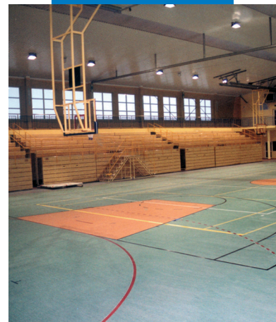
Esempio di utilizzo di Primer G prima della posa di PVC e linoleum in una palestra pubblica - Palestra indoor Gdansk Orunia - Polonia

I contenuti della presente Scheda Tecnica possono essere riprodotti in altro documento progettuale, ma il documento così risultante non potrà in alcun modo sostituire o integrare la Scheda Tecnica in vigore al momento dell'applicazione del prodotto Mapei. Per la Scheda Tecnica e le informazioni sulla garanzia più aggiornate, si prega di visitare il nostro sito web www.mapei.com . QUALSIASI ALTERAZIONE DEL TESTO O DELLE CONDIZIONI CONTENUTI IN QUESTA SCHEDA TECNICA O DA ESSA DERIVATI RENDERÀ INAPPLICABILI TUTTE LE RELATIVE GARANZIE MAPEI.