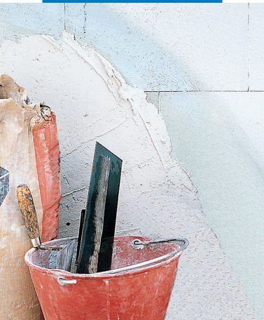
Uso come Primer per intonaci in gesso