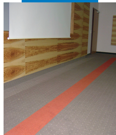
Esempio di utilizzo di Primer G prima della stesura di Ultraplano Eco e dell'adesivo Rollcoll per l'incollaggio della moquette nelle stanze dell'albergo - Villa Hotel Castellani - Austria

Le referenze relative a questo prodotto sono disponibili su richiesta e sul sito www.mapei.it e www.mapei.com