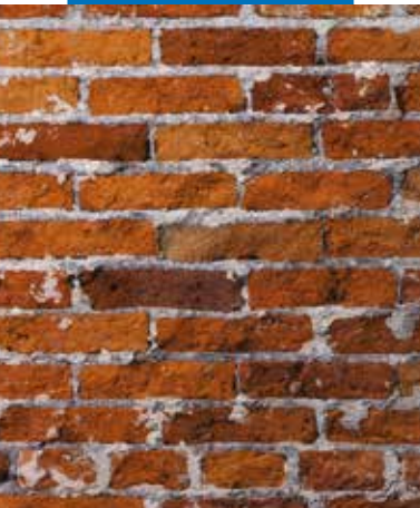
Muratura in mattoni dopo la rimozione dell'intonaco degradato