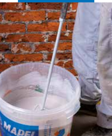
Preparazione di Mape-Antique Rinzafo