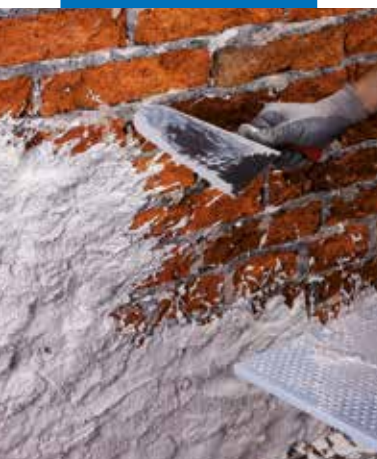
Applicazione di Mape-Antique Rinzafo

Nella tabella dei dati tecnici (nelle sezioni Dati Applicativi e Prestazioni Finali) sono riportati alcuni valori tipici, legati alle principali caratteristiche sia allo stato fresco che indurito di Mape-Antique Rinzafo .