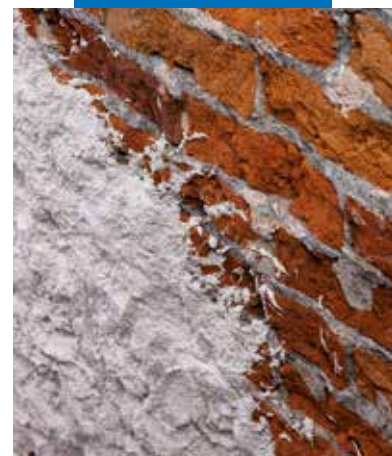
Particolare di Mape-Antique Rinzafo